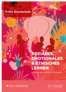
ca. 5–7 Jahre

Die Unterrichtsmaterialien lassen sich unabhängig von der Schulform und von Leistungsniveaus einsetzen. Sie eignen sich auch für altersdurchmischte, heterogene Klassen.