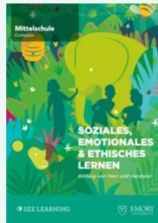
ab 11 Jahren

Ein weiteres Lehrmittel für die Oberstufe und die Erwachsenenbildung ist in Arbeit. Alle Materialien können als gebundene Druckversion oder als PDF erworben werden. Der Download der Kapitel 1 und 2 ist kostenlos. Die Voraussetzung für den Erwerb der vollständigen Curricula ist der Besuch eines Einführungskurses oder des Online-Kurses SEE 101. Mehr Informationen und eine Preisliste gibt es auf der Homepage.